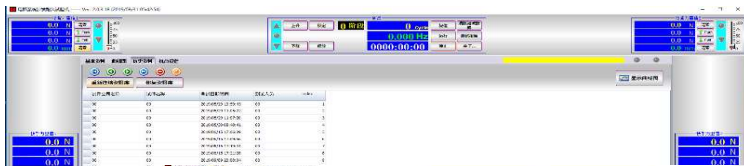
历史测试资料库 (左图)