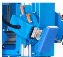
靠背交替加载组件