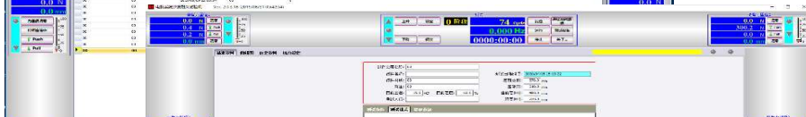
模式设定界面 (左图)